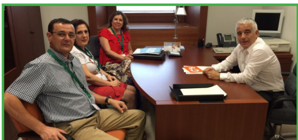
Reunión Grupo Parlamentario Ciudadanos, 8 de julio de 2015