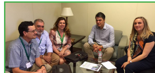
Reunión Grupo Parlamentario Popular, 2 de julio de 2015