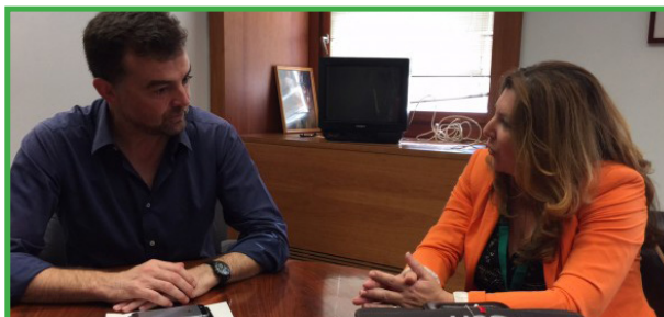
Reunión Grupo Parlamentario Izquierda Unida, 1 de julio de 2015