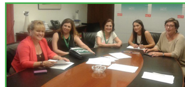
Reunión Grupo Parlamentario Socialista, 29 de julio de 2015

USO ya vaticinó lo que podría ocurrir con la firma del chapucero acuerdo del 23 de diciembre de 2014. Los firmantes de semejante "acuerdo" (FSIE y UGT), aceptaron que la cantidad correspondiente a 2015, la pagara la Consejería a lo largo de tres años (suponían que 2015, 2016 y 2017). Ahora, la realidad es que estamos en el mes de octubre y aún no han pagado ni un solo euro y lo único que hemos constatado es que los compañeros de pública recuperaron en junio su parte adicional de la paga y en diciembre, también la recuperarán. Por tanto, del 100% de Equiparación conseguida en 2011, se ha retrocedido a un 96%.